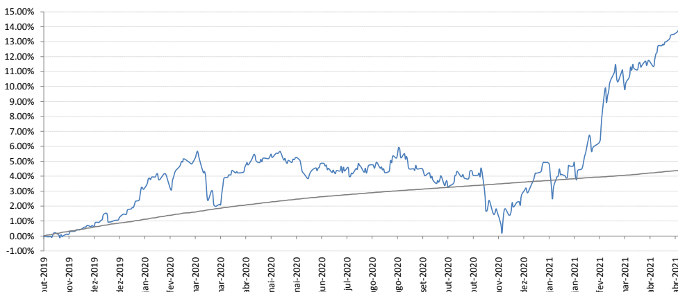
Gráfico de Rentabilidade - ENTERCAPITAL TURING FIC FIM