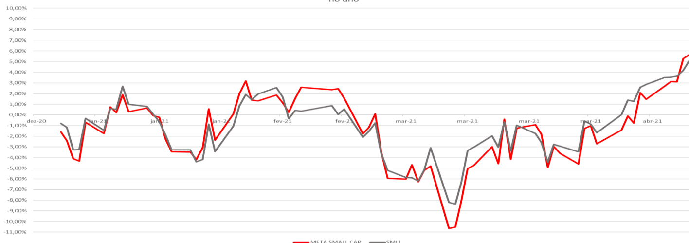
Performance acumulada do Meta Small CAP no ano